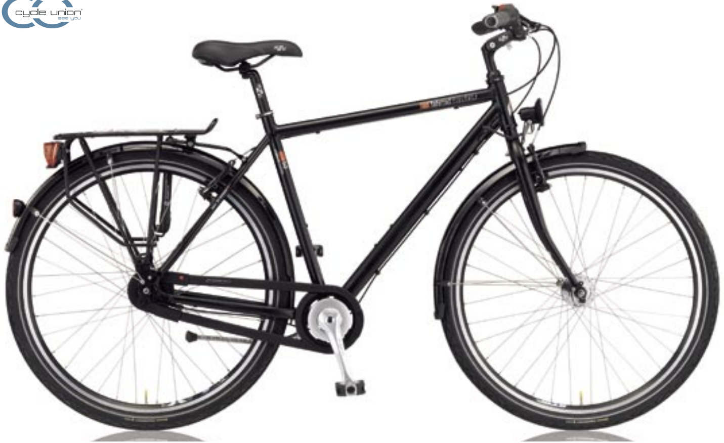
T-50 (Shimano Nexus 8-Gang / FL)