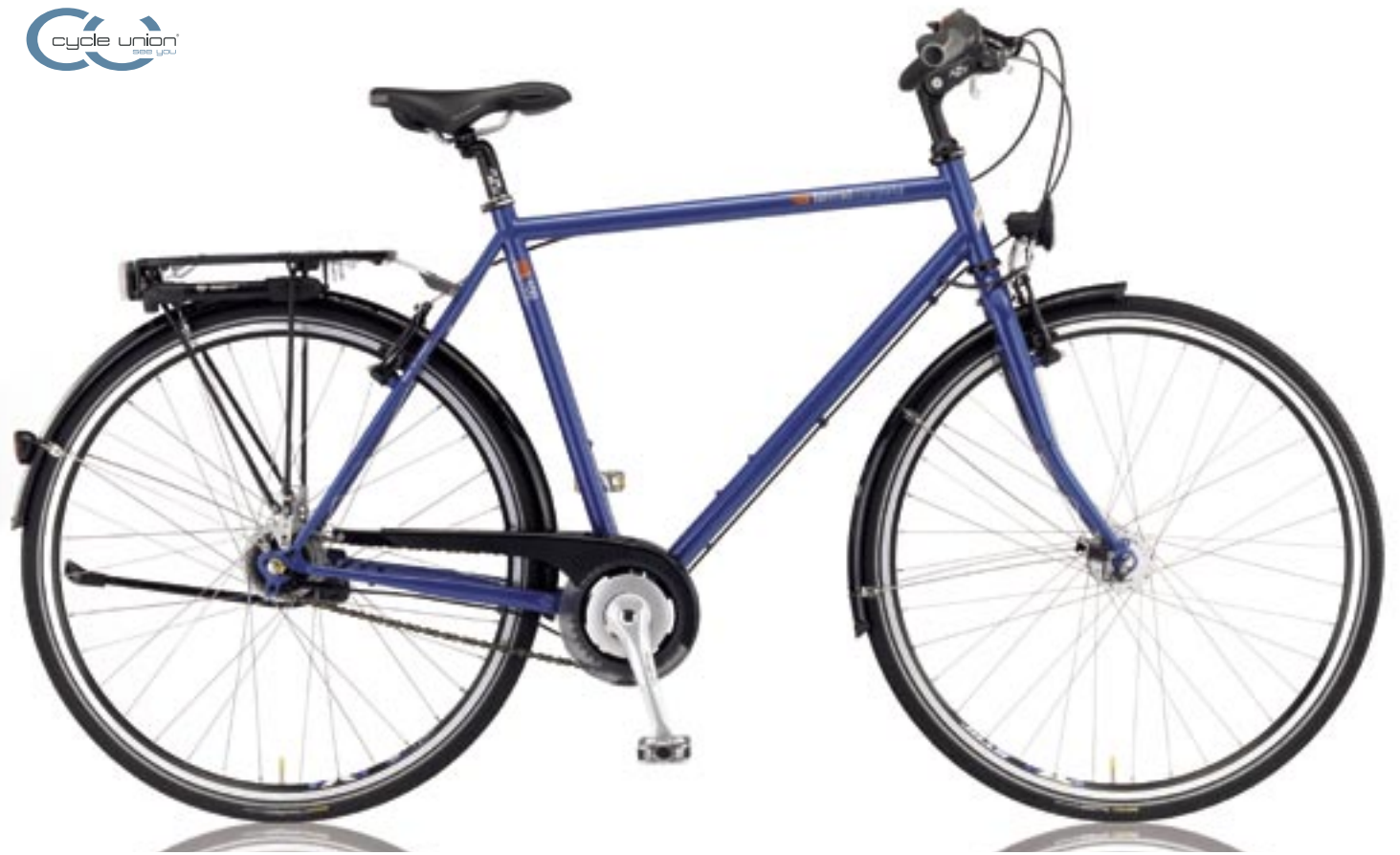
T-100 (Shimano Nexus 8-Gang / FL)