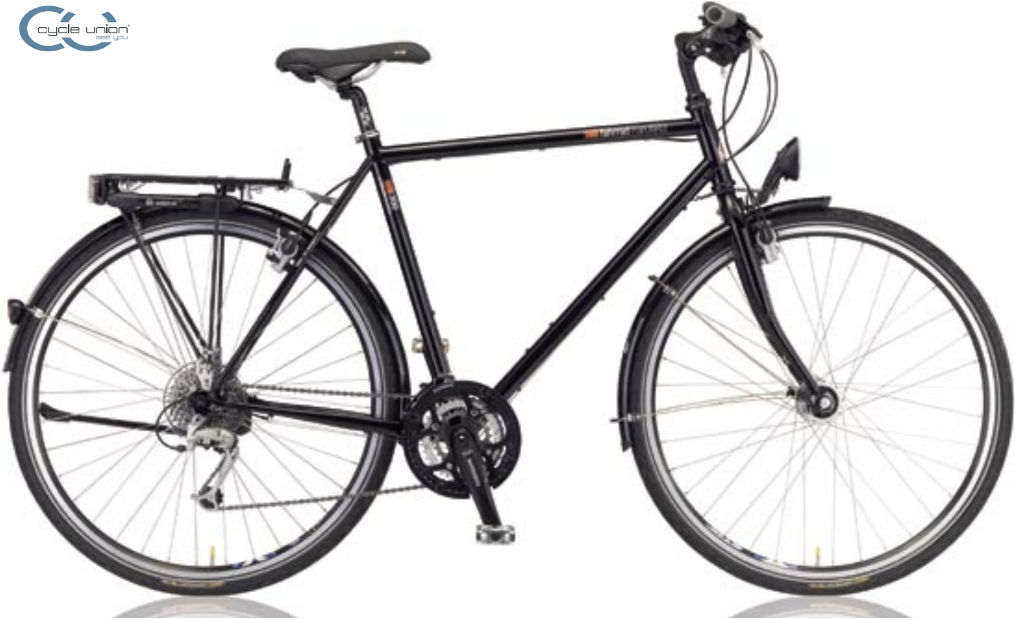
T-300 (Shimano Deore LX 27-Gang)