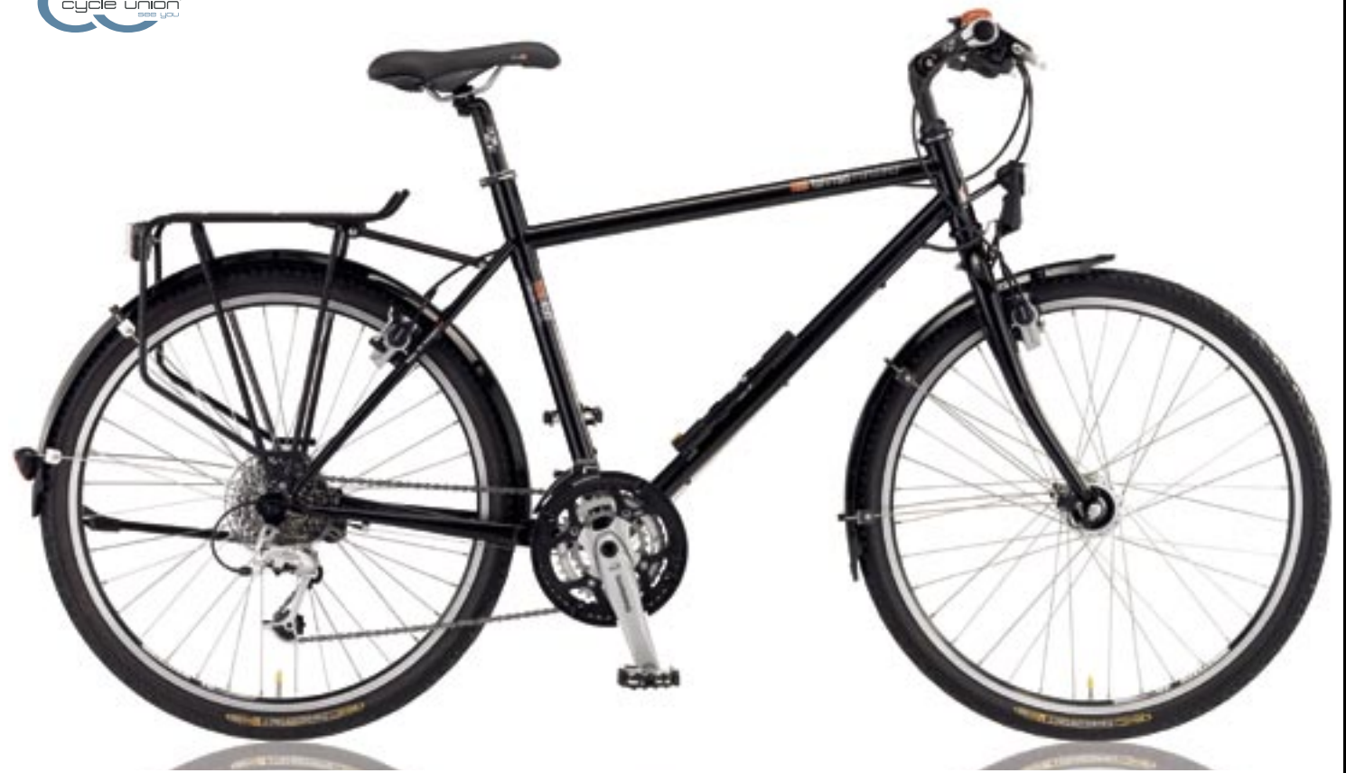
T-400 (Shimano Deore LX 27-Gang)