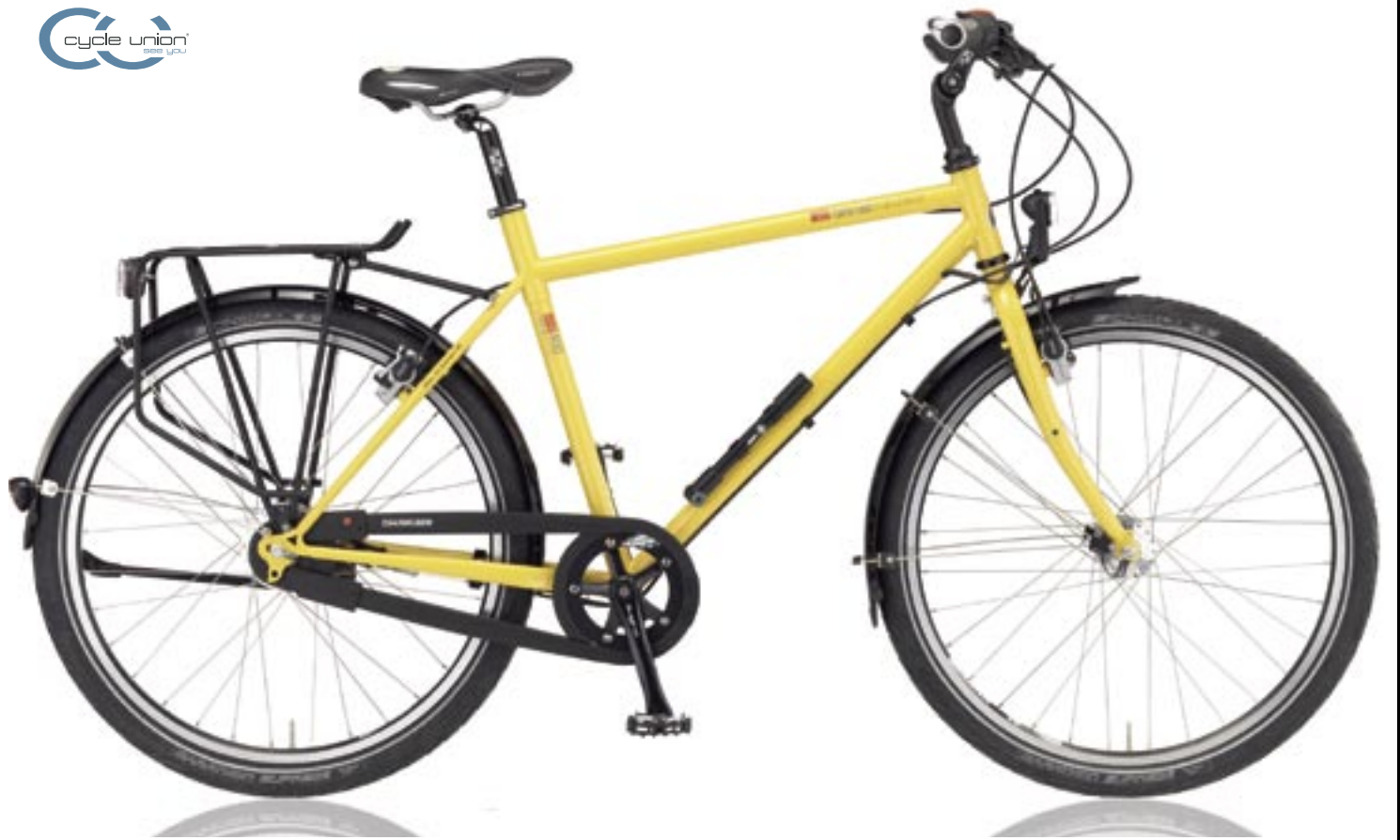
T-400 (ROHLOFF 14-Gang)